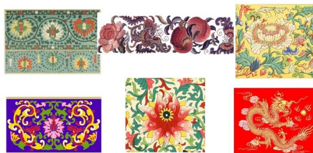
Китайские узоры и орнаменты

Важными элементами стали изображения, несущие в себе магическую функцию, символику: цикады предвещали урожай, стебли бамбука олицетворяли стойкость и мудрость, дикая слива (мейхуа) — верную дружбу, персик — символ бессмертия, плод граната намекал на многочисленное потомство, цветы пиона — знатность и богатство, зеленая сосна, цепляющаяся своими корнями за скалы, — долголетие и стойкость к жизненным неурядицам, бык и баран сулили людям сытость и богатство. Фантастическая маска-зверь тао-тэ (таотэ) соединяет черты тигра, барана, дракона. Одно из ее значений — защита от злых духов. Цветок и порхающая рядом бабочка — любовь. Представление о благодати связано с чудовищем-драконом с головой хамелеона, рогами оленя, ушами быка, хвостом змеи, пятью когтями орла, чешуей рыбы. Это изображение приобретает значение символа императорского могущества и совершенства.